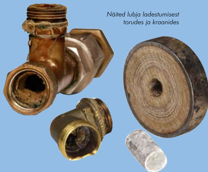
Näited lubja ladestumisest torudes ja kraanides